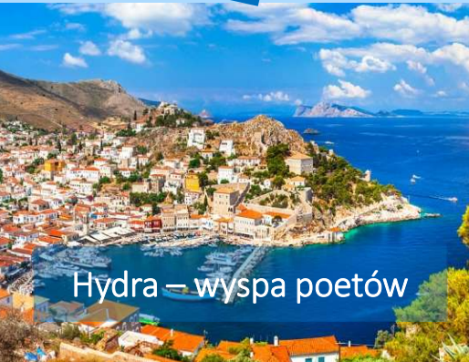
Hydra – wyspa poetów