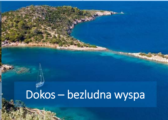
Dokos – bezludna wyspa