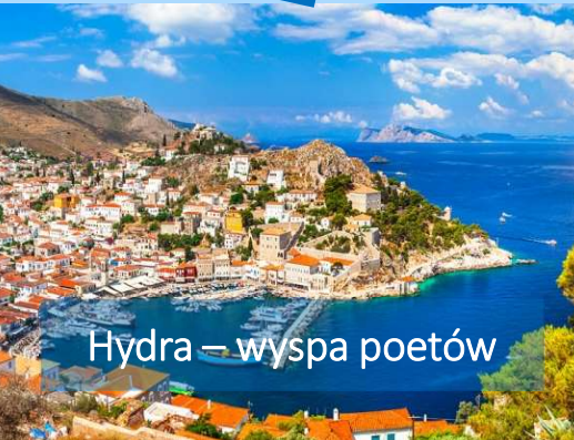
Hydra – wyspa poetów