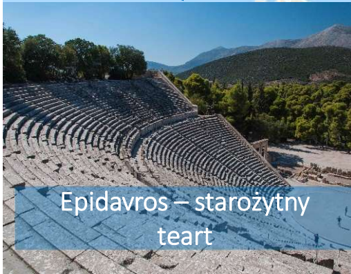
Epidavros – starożytny teatr