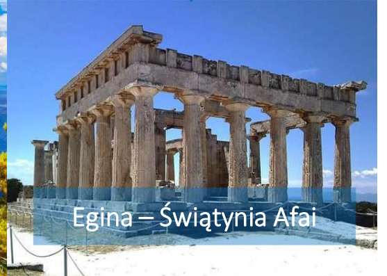
Egina – Świątynia Afai